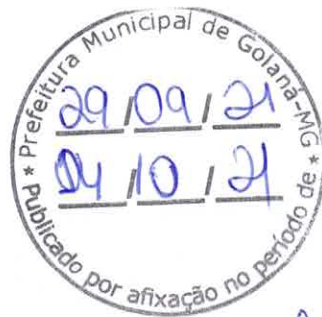
Estevam de Assis Barreiros Prefeito Municipal