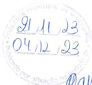
Estevam de Assis Barreiros Prefeito de Goianá