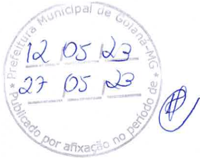
Estevam de Assis Barreiros Prefeito de Goianá-MG