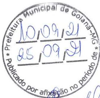
Estevam de Assis Barreiros Prefeito Municipal