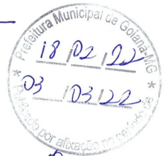
Estevam de Assis Barreiros Prefeito Municipal